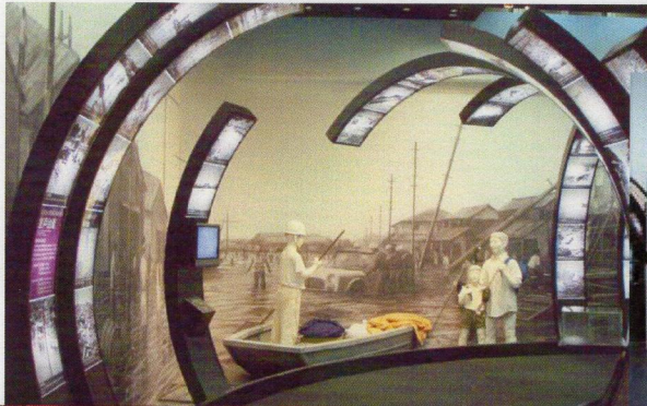
津波・高波ステーション