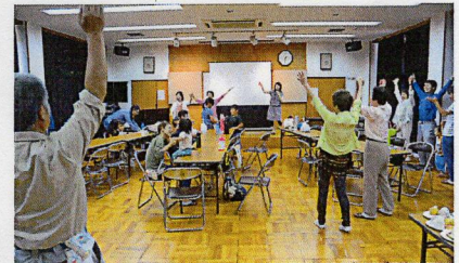
身体表現 感情表現