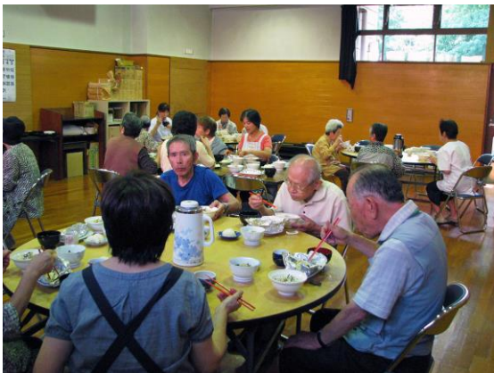
まちに待った昼食の時間。今日の味は、量は！