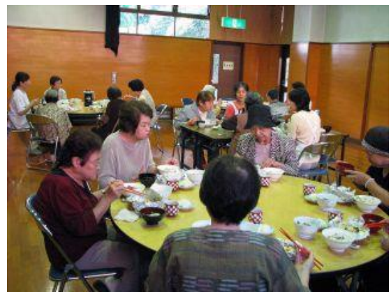
サツマイモご飯がめずらしいとのこと！満腹！