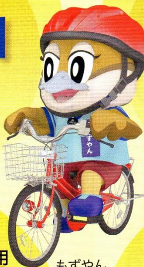
もずやん 大阪府広報担当 副知事