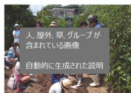
人、屋外、草、グループが含まれている画像

芸術感性を通して、未来を生きる子ども達と豊かな心を育んでいくため、教育関係や各地域でのイベントで、一緒に活動して下さる方を募集しています。