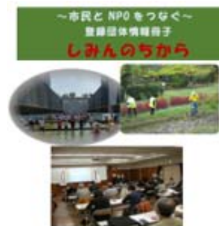
2021年度(令和3年度)第9期 大阪狭山市市民活動支援センター